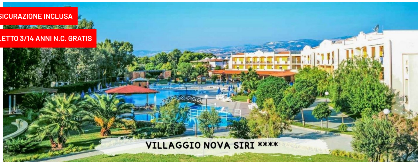
VILLAGGIO NOVA SIRI ****

quote a persona in pensione completa con soft all inclusive