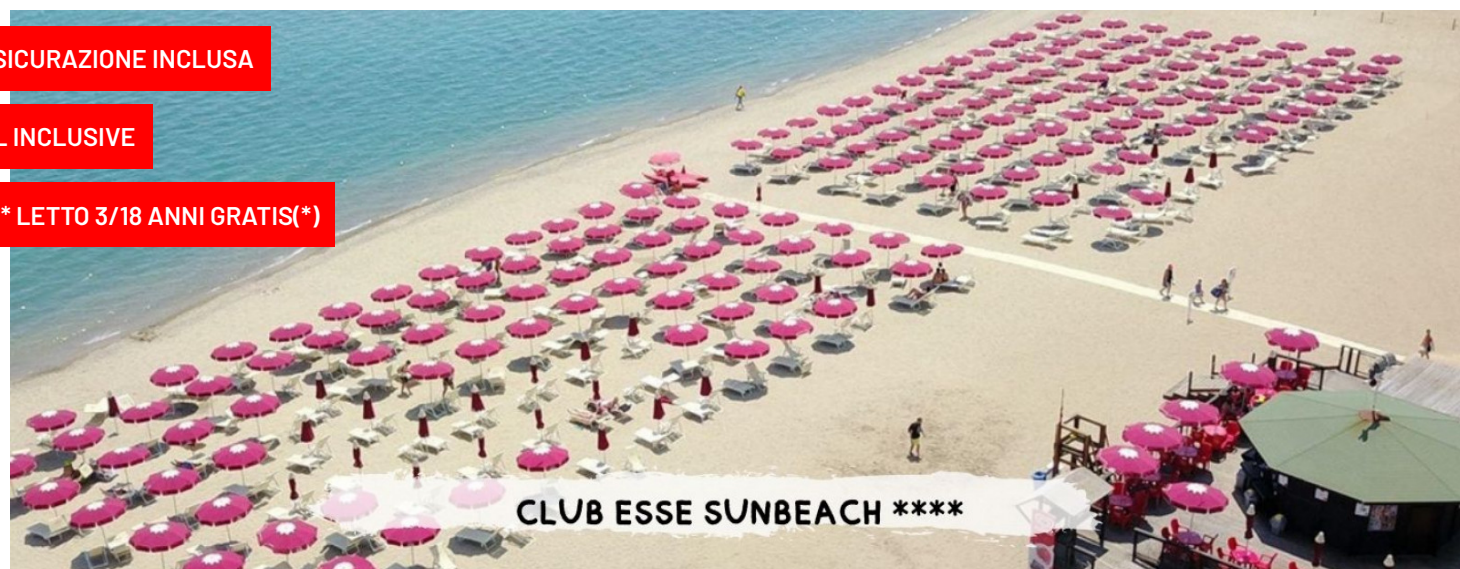
CLUB ESSE SUNBEACH ****