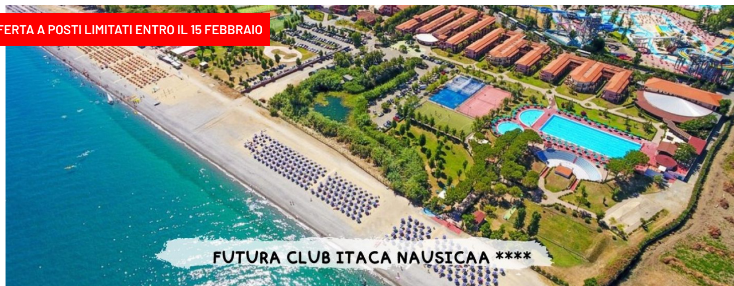
FUTURA CLUB ITACA NAUSICAA ****

OFFERTA A POSTI LIMITATI ENTRO IL 15 FEBBRAIO