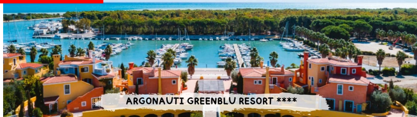
ARGONAUTI GREENBLU RESORT ****