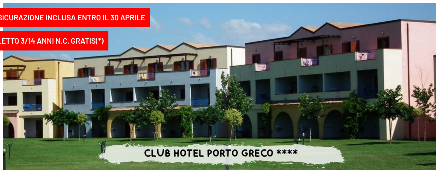
CLUB HOTEL PORTO GRECO ****

quote a persona in pensione completa – bevande incluse in formula "mondotondo club"