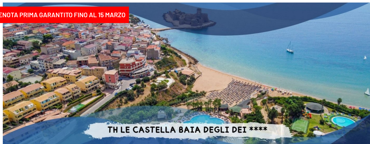
TH LE CASTELLA BAIÀ DEGLI DEI ****

PRENOTA PRIMA GARANTITO FINO AL 15 MARZO