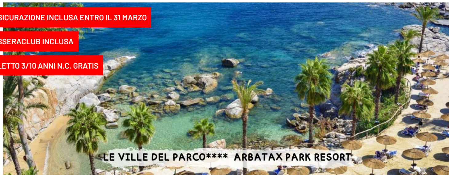
LE VILLE DEL PARCO**** ARBATAX PARK RESORT

sistemazione "le ville del parco" – camera standard pensione completa – bevande incluse – tessera club inclusa pacchetti con nave + auto o in solo soggiorno -7/10/11 notti