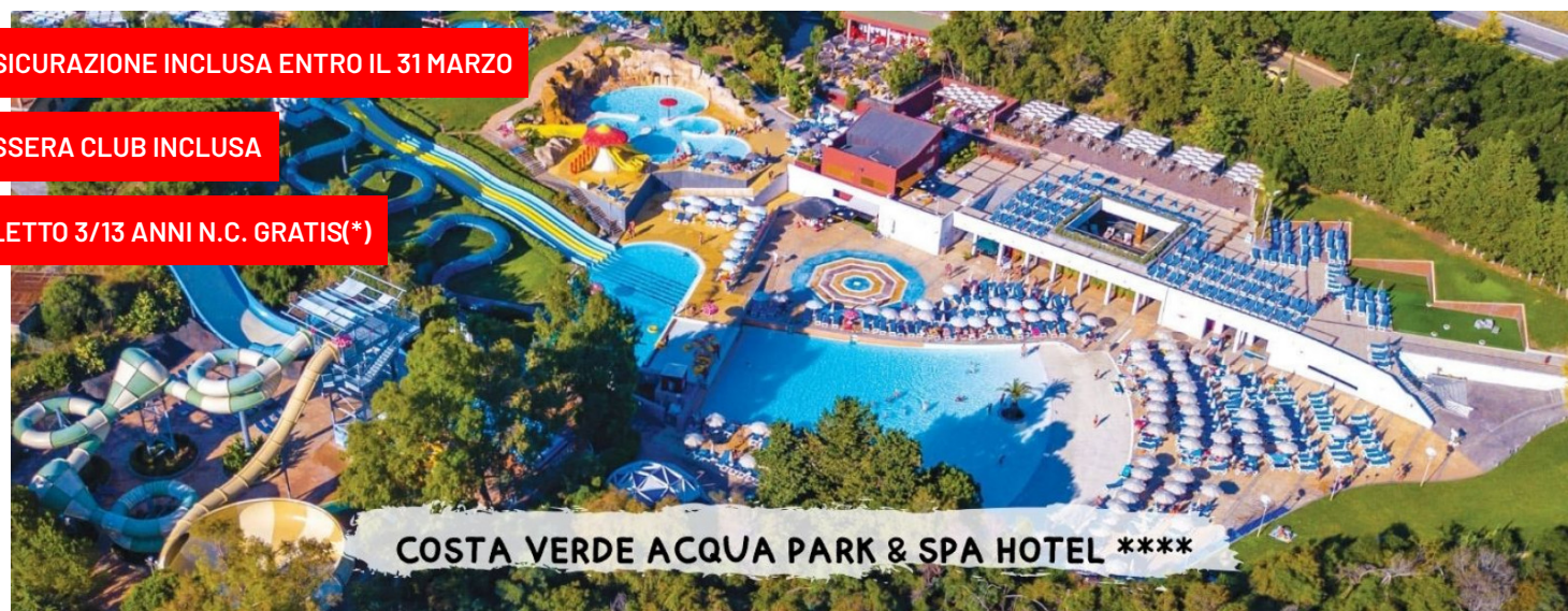
COSTA VERDE ACQUA PARK &amp; SPA HOTEL ****