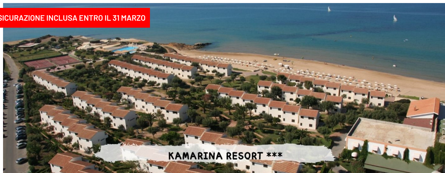
KAMARINA RESORT ***