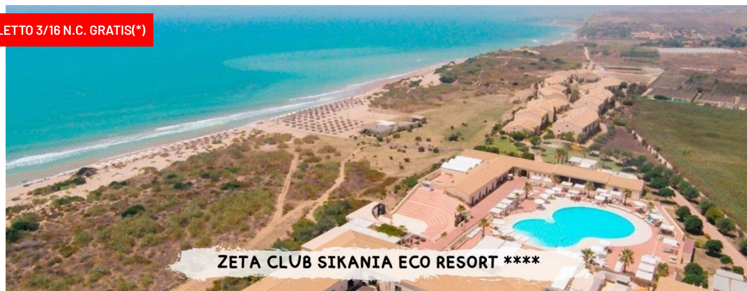
ZETA CLUB SIKANIA ECO RESORT ****