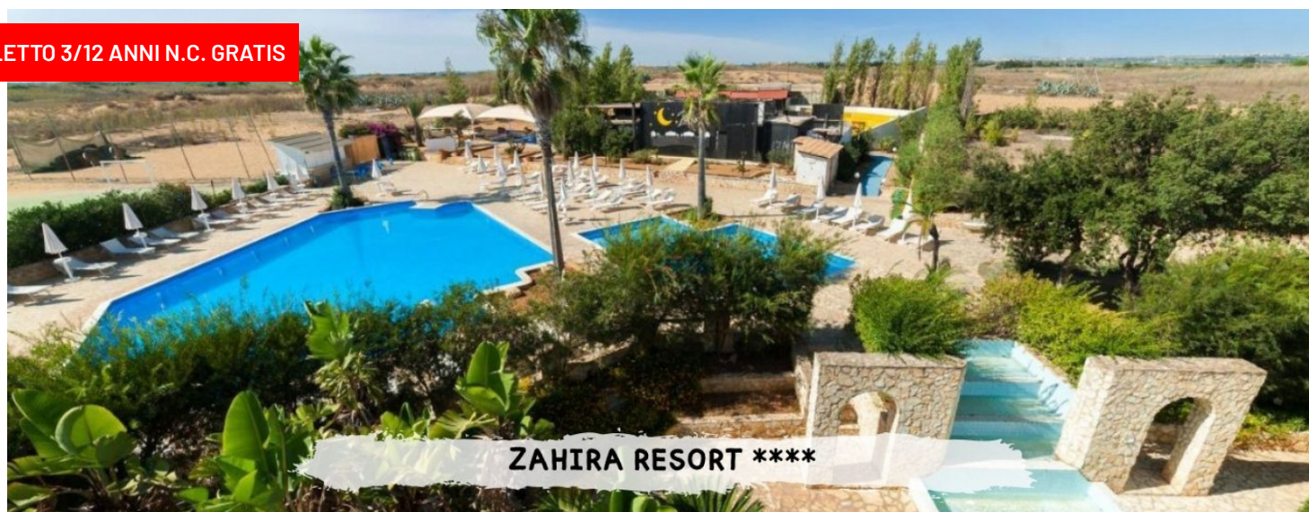
ZAHIRA RESORT ****