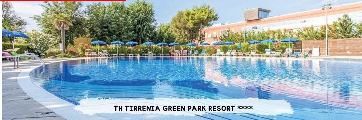
TH TIRRENIA GREEN PARK RESORT ****

PRENOTA PRIMA GARANTITO FINO AL 15 MARZO