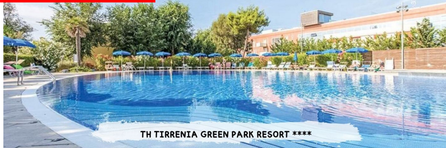
TH TIRRENIA GREEN PARK RESORT ****

PRENOTA PRIMA GARANTITO FINO AL 15 MARZO