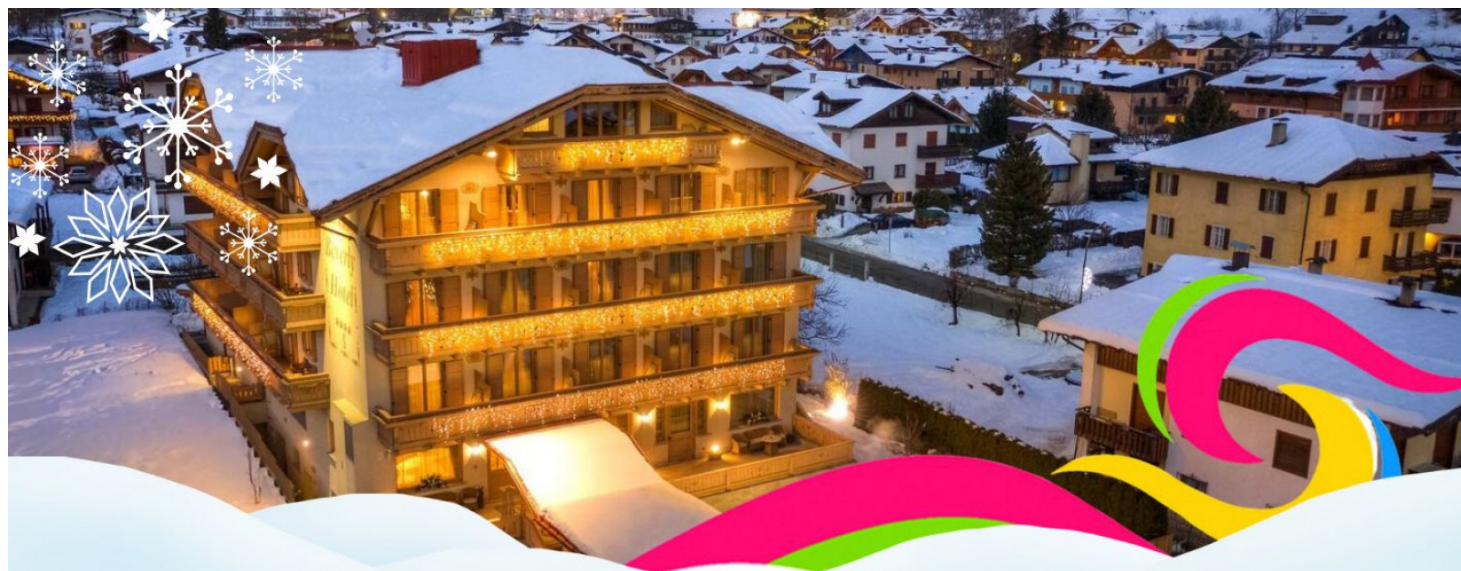
Tariffa per persona al giorno in camera e colazione - Tariffa netta valida dal 01/11/25