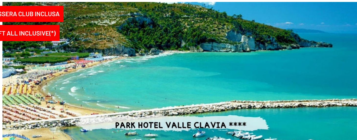
PARK HOTEL VALLE CLAVIA ****

quote a persona a settimana in all soft inclusive(*)