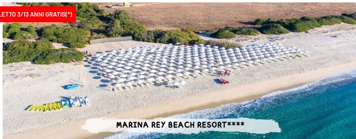
MARINA REY BEACH RESORT****

quote a persona in pensione completa bevande incluse ai pasti